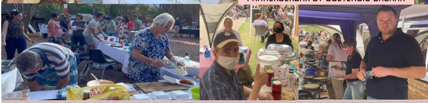
PANNEKOEKBAK BY OUETEHUIS BASAAR